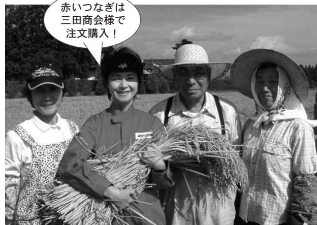
黄金色の「惣兵衛米」たんぼ